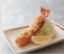
天然大えびフライ