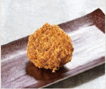
やわらかヒレかつ