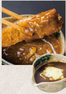
金沢みそチーズ 180円