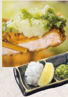
鬼おろしセット 180円