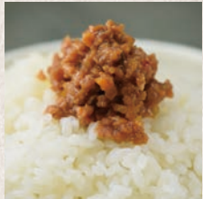
かつぞうの豚みそ 90円